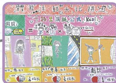
「體能活動大比拼」 銅獎 鄭天欣