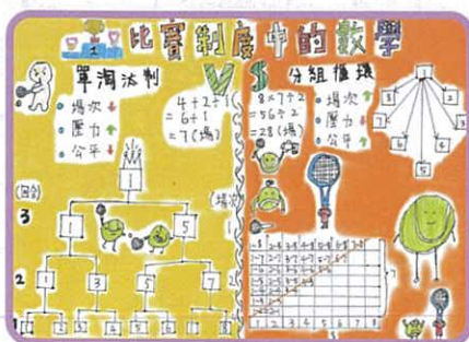
「比賽制度中的數學」 金獎 歐陽子游